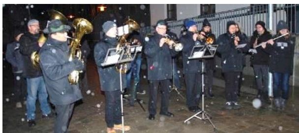
Die Musikkapelle der MG Pernersdorf sorgte für eine vorweihnachtliche Stimmung