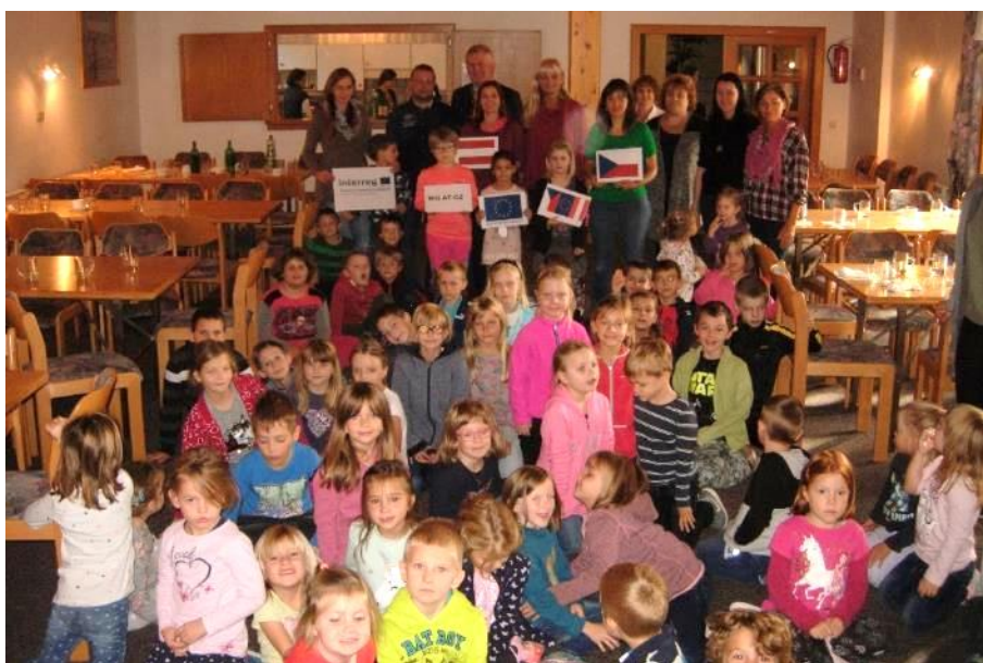
Kindergartentreffen im Dorfhaus Pfaffendorf-Karlsdorf